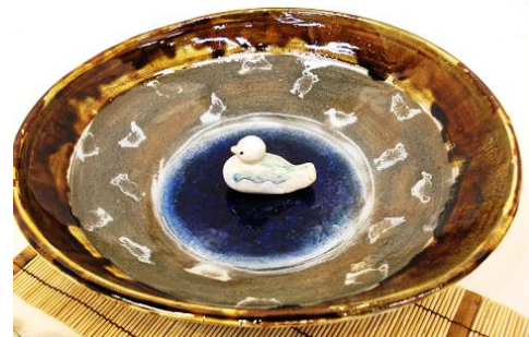
「大皿」 益子赤 粉引象嵌 飴釉 ガラス釉 灯油窯

取っ手がとても上手にできているこの大皿は、土が赤なので織部釉を掛けたらこのように濃い緑になりました。その上に透明釉を掛けて何種類かのガラスを入れてあります。底の周りが白いの透明釉の影響だと思えます。土笛は見本をいただいたので作ってみました。もう少し鳴るように挑戦してみたい。