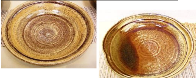
4「チタン黄茶窯変大鉢」 チタン黄茶窯変釉(自作釉) 還元焼成

3「チタン黄茶窯変大鉢」 4「チタン黄茶窯変大鉢」 昨年、P 釉を2度焼いて出したが今年はその釉を2度焼くところを1度でやるため倍の時間で焼いた。チタンが入っているのと黄色っぽいので「チタン黄茶窯変」と名前を付けた。4の溜まっている部分は松灰釉を乾燥させた粉を掛けた。本当は緑色になるのを狙ったのだが、元の釉薬との相性なのか緑色にならず茶色になった。