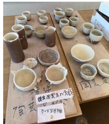
完成した参加者の作品