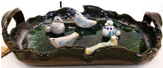
「大皿」 信楽赤 織部釉 ガラス釉 電気窯 「土笛(6点)」 信楽土 絵の具 透明釉 灯油

取っ手がとても上手にできているこの大皿は、土が赤なので織部釉を掛けたらこのように濃い緑になりました。その上に透明釉を掛けて何種類かのガラスを入れてあります。底の周りが白いの透明釉の影響だと思えます。土笛は見本をいただいたので作ってみました。もう少し鳴るように挑戦してみたい。