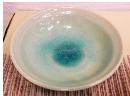
7「掛け分け中鉢」 青白交趾釉(内側)+トルコマット釉(外側)掛け分け 酸化焼成

5「粉引松灰釉大鉢」 6「掛け分け大鉢」 この作品の基本は粉引き。白化粧土を塗って松灰釉を掛けて先ほどの粉になった松灰釉をパラパラとかけた。本当はもうちょっと全体が緑色になることを狙ったが流れて溜まったところが濃い緑色になった。 6 もススキ釉だけじゃ面白くないので亀甲貫入釉を粉末で買ったので、それを粉でパラパラとかけた。1240℃で焼いたがきれいに溶けた。