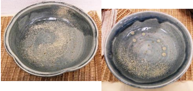
2「淡青松灰鉢」 淡青松灰釉(自作釉) +ディオブサイド釉吹付 酸化焼成