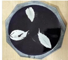
木の葉天目に挑戦