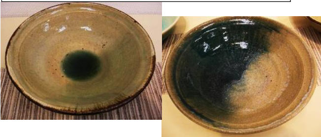
6「掛け分け大鉢」 ススキ釉+亀甲貫入釉 粉末振り掛け 還元焼成

5「粉引松灰釉大鉢」 6「掛け分け大鉢」 この作品の基本は粉引き。白化粧土を塗って松灰釉を掛けて先ほどの粉になった松灰釉をパラパラとかけた。本当はもうちょっと全体が緑色になることを狙ったが流れて溜まったところが濃い緑色になった。 6 もススキ釉だけじゃ面白くないので亀甲貫入釉を粉末で買ったので、それを粉でパラパラとかけた。1240℃で焼いたがきれいに溶けた。